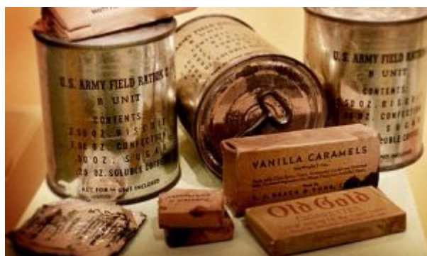
на фото пример пайка С-рацион

Полицию очень заинтересовал вопрос, куда пропали туфли Вейхера и почему остались кроссовки Матиаса. Как было сказано, ноги Вейхера были сильно обморожены, что уже начиналась развиваться гангрена. Следствие предположило, что туфлями воспользовался именно Матиас. Дело в том, что рост Матиаса был 178 см и вес 77 кг, а вес Вейхера 90 кг. Можно предположить, что Гэри Матиас тоже страдал от обморожения ног. И если у него начиналась влажная гангрена, то он мог воспользоваться туфлями Вейера. Надо пояснить, что представляет собой гангрена, в частности влажная.