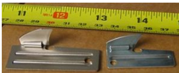
на фото открывалка Р-38